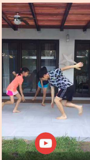
family.fit pet koraka

Pronađite sve video zapise za family.fit na family.fit YouTube® kanalu