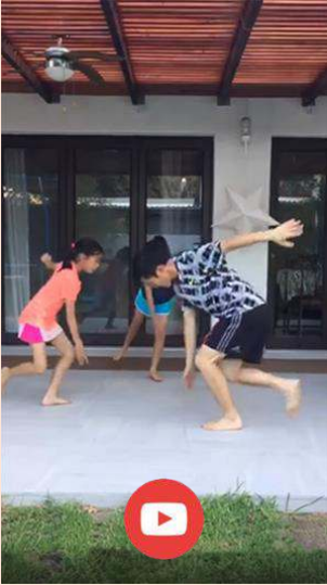
ఫ్యామిలీ.ఫిట్ ఐదు దశలు

ఫ్యామిలీ.ఫిట్ కోసం అన్ని వీడియోలను family.fit YouTube® ఛానెల్లో కనుగొనండి